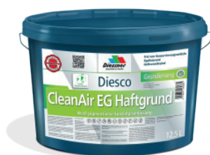
CleanAir EG Haftgrund