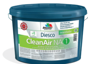
CleanAir NA 1