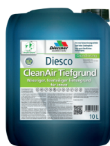
CleanAir Dybdegrunder W