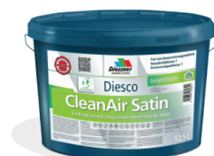
CleanAir Satin vægmalning