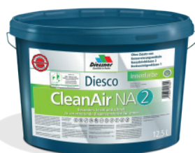
CleanAir NA 2