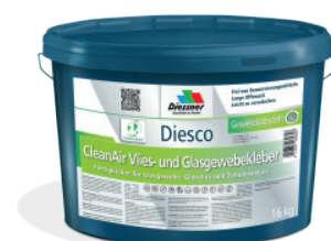
CleanAir Filt- og Vævkæber